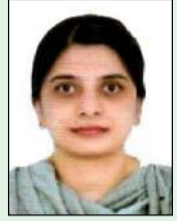
തയാറാക്കിയത്: സിന്ധർ ബെറ്റ്സി ബിനു