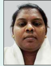
തയ്യാറാക്കിയത്: സിസ്റ്റർ രേഖ സജിമോൻ