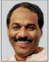
ജെ എസ് അടുർ