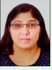
തയ്യാറാക്കിയത്: സിസ്റ്റർ ജൂലി സുനിൽ