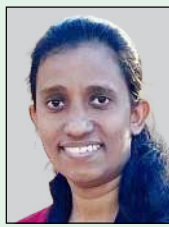
തയ്യാറാക്കിയത്: സിസ്റ്റർ ധന്യ ഡാനിയേൽ