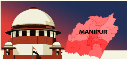
വിവരം കൈമാറണമെന്നും ചീഫ് ജസ്റ്റിസ് ആവശ്യപ്പെട്ടു.

ന്യൂഡൽഹി: കലാപം തുടരുന്ന മണിപ്പൂരിൽ ഭരണഘടനാ സംവിധാനം തകർന്നെന്നും മേയ് മാസം മുതൽ ജൂലൈവരെ അവിടെ നിയമം ഇല്ലാത്ത അവസ്ഥയായിരുന്നെന്നും തുറന്നടിച്ച സുപ്രീം കോടതി. പൊലീസിൽ വിശ്വാസം നഷ്ടപ്പെട്ടെന്നും എഫ്.ഐ.ആർ രജിസ്റ്റർ ചെയ്യുന്നതിൽ വലിയ കാലതാമസം ഉണ്ടായെന്നും വ്യക്തമാക്കിയ സുപ്രീം കോടതി, വെള്ളിയാഴ്ച രണ്ടു മണിക്ക് ഡിജിറ്റൽ നേരിട്ടു ഹാജരായി വിവരങ്ങൾ നൽകാണമെന്നും ഉത്തരവിട്ടു.