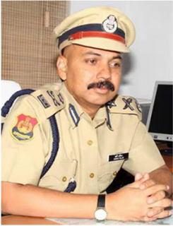
മണിപ്പൂരിൽ ഡിജിപിയെ ശകാരിച്ച് സുപ്രീം കോടതി