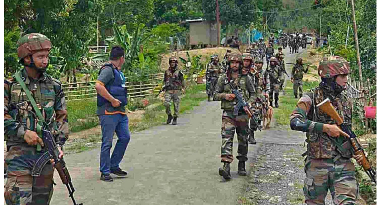
സ്ഥാനങ്ങളുടേയും സുരക്ഷാചുമതല ഒരു സേനയ്ക്ക് മാത്രമായി നൽകിയേക്കാം. നിലവിൽ സംഘർഷ പ്രദേശങ്ങളിൽ, എല്ലാ സേനകളിൽ നിന്നുള്ളവരേയും വിന്യസിച്ചിട്ടുണ്ട്.

ക്രമസമാധാനം പുനഃസ്ഥാപിക്കാനായി കൂടുതൽ സൈന്യത്തെ പ്രദേശത്ത് വിന്യസിച്ചതായി പോലീസ് അറിയിച്ചു. വെടിവയ്പ്പിൽ നിന്ന് രക്ഷപ്പെട്ട മെയ്തികൾ നീതി തേടി മുതദേഹങ്ങളുമായി ഇംഫാലിൽ മാർച്ചിന് ഒരുങ്ങുന്നതായും റിപ്പോർട്ടുകളുണ്ട്. വംശീയ സംഘർഷം കണക്കിലെടുത്ത് ഗ്രാമത്തിൽ കാവലിരുന്നവരാണ് മരിച്ച മൂന്ന് മെയ്തി സമുദായാംഗങ്ങളും. കാവൽ നിൽക്കുന്നവർ ഉപയോഗിച്ചിരുന്ന രണ്ട് തോക്കുകൾ തട്ടിയെടുത്താണ് ആക്രമികൾ വെടിയുതിർത്തത്. ഇതോടെ ഗ്രാമത്തിലെ മെയ്തികളും ആക്രമണം അഴിച്ചുവിട്ടു. അടുത്തുള്ള കുടി ഗ്രാമത്തിന് മെയ്തികൾ തീയിട്ടു. ഗ്രാമവാസികൾ ഓടിപ്പോയതിനാൽ ആളുപായമുണ്ടായില്ല. മണിപ്പൂരിൽ മെയ്തി മൂന്നിന് ആരംഭിച്ച ഏറ്റുമുട്ടലിൽ ഇതുവരെ 160പേർ കൊല്ലപ്പെടുകയും നിരവധി പേർക്ക് പരുക്കേൽക്കുകയും ചെയ്തിരുന്നു. സ്ഥിതിഗതികൾ ശാന്തമാവാതെ തുടരുന്നതിനാൽ കൂടുതൽ സുരക്ഷാസേനയെ വിന്യസിക്കും. നിലവിൽ മണിപ്പൂരിൽ 40,000ത്തോളം കേന്ദ്രസേനാംഗങ്ങളുണ്ട്. ഇംഫാലിന്റേയും ജില്ലാ ആ