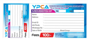
സ്. ഇതിൽ നിന്ന് ലഭിക്കുന്ന 15 ശതമാനം സ്റ്റേറ്റ് കമ്മിറ്റിയിലേക്കുമാണ് ക്രമീകരിച്ചിരിക്കുന്നത്.